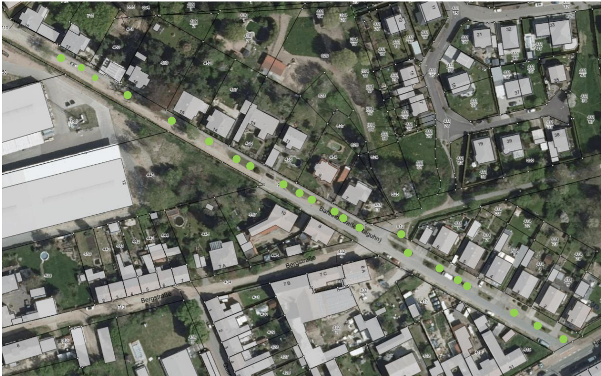
Abbildung 2 Bahnhofstraße

Ziel ist, im Straßenverlauf keine Mono-Bepflanzung umzusetzen. Sondern die Artenvielfalt und Widerstandsfähigkeit durch vielfältige Pflanzungen in der Stadt zu stärken.